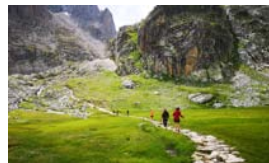
RANDONNÉE PÉDESTRE AU COEUR DE LA VALLÉE DE LA CLARÉE