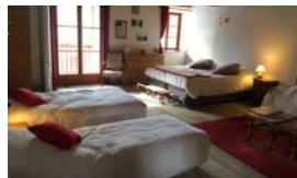
VOTRE HÉBERGEMENT « LES CHAMBRES D'ANAVO »

à partir de 559€/personne** En tout compris