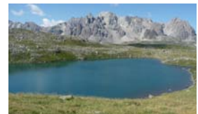
DE 1 À 3 LACS PAR JOUR ET VOUS N'AUREZ PAS TOUT VU !